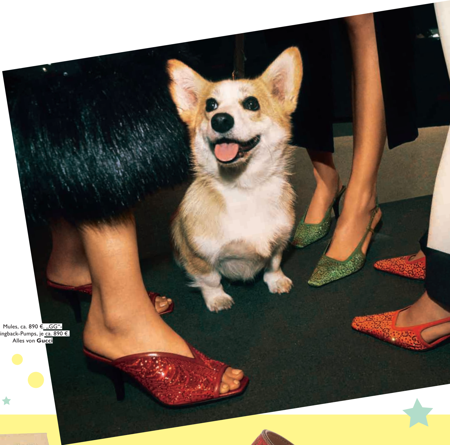
Mules, ca. 890 € „GG“ Slingback-Pumps, je ca. 890 € Alles von Gucci